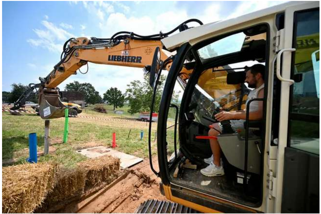
Il fallait faire preuve d'adresse à bord de la pelleuse.