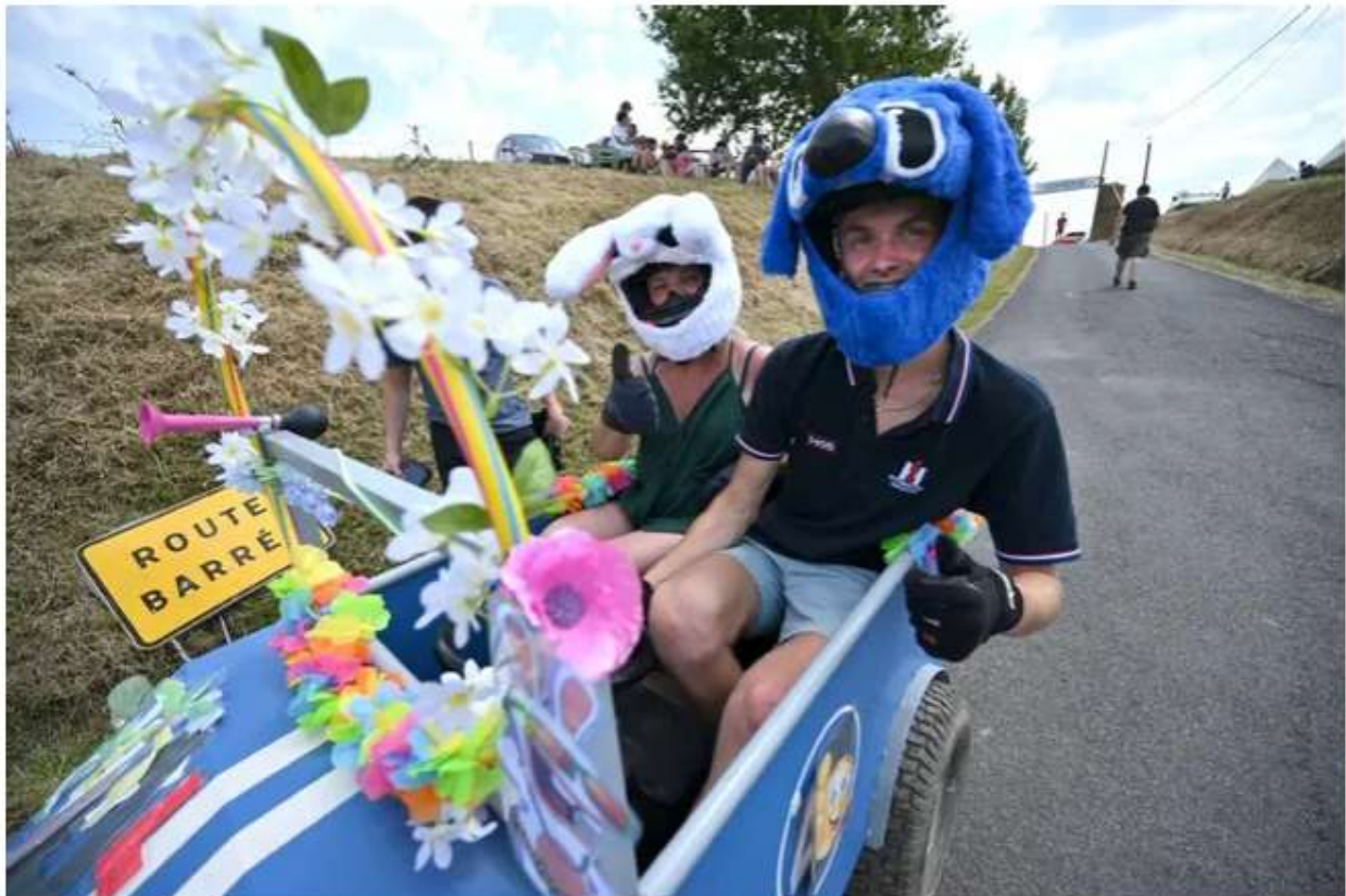
Descente de caisse à savon au Puy d'Arnac

Courses de caisses à savon, concours de pelleteuses ou encore ventrigrisse géant... Cet été, les traditionnelles fêtes votives ont pris un tournant original en Corrèze. Historiquement célébrées autour du 15 août avec des attractions foraines, tombolas, concours de pétanque et des bals dansants, elles deviennent maintenant de plus en plus folles et créatives. Exemples à Lissac-sur-Couze et à Puy d'Arnac.